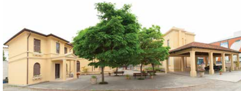
Visão geral do Museu da Energia de São Paulo e sede da Fundação Energia e Saneamento.