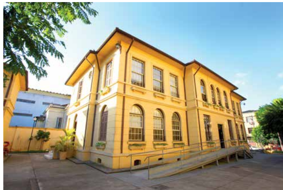
Fachada do Edifício Administrativo.