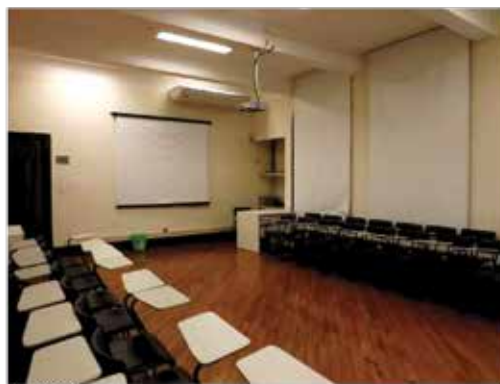
Sala de aula