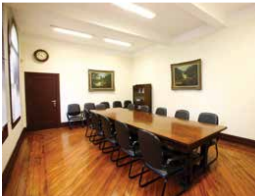
Sala de reuniões